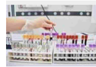
Biologi lanciano le Giornate di prevenzione, a giugno laboratori aperti