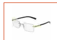
Dolce & Gabbana occhiali da vista Basalto Collection DG1260K 02