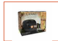
Lierac The Bridge Cofanetto Premium Anti-EtÀ Globale