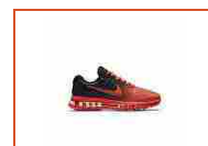
Nike Air Max 2017