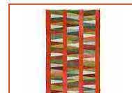
Tappeto Kilim Patchwork 160x266 Tappeto Moderno