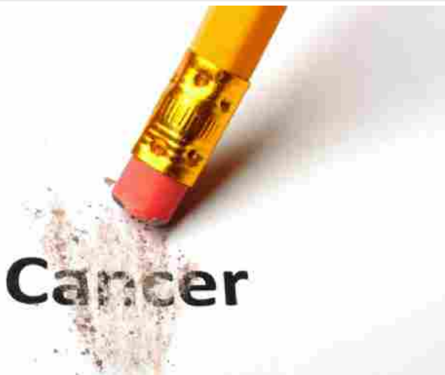
Tenere sotto controllo il cancro e le mutazioni genetiche correlate

ROMA - Poter monitorare le mutazioni genetiche collegate a i tumore. Ecco che arriva 'Helixafe' il programma sviluppato da Bioscience Genomics, spin off dell'Università di Tor Vergata che permette, attraverso un semplice prelievo di sangue, di valutare il profilo individuale di stabilità genetica, che si aggiorna periodicamente (ogni anno) mediante la ripetizione del test della lettura delle mutazioni. Quanto più il monitoraggio si estende nel tempo, tanto più diventa accurato il risultato.