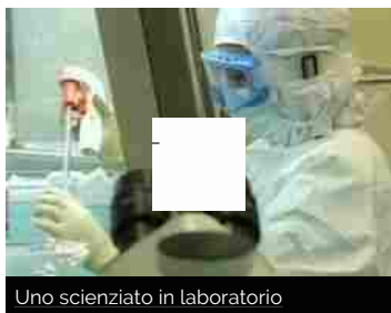
Uno scienziato in laboratorio

sabato 2 luglio 2016 | Da San Marino parte una speranza per rendere la vita meno dolorosa ai malati di diabete e altre patologie. Il Bioscience Institute di San Marino ha sperimentato una cura inedita per trattare le cosiddette 'ferite difficili'