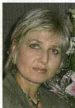
di Monica Melotti